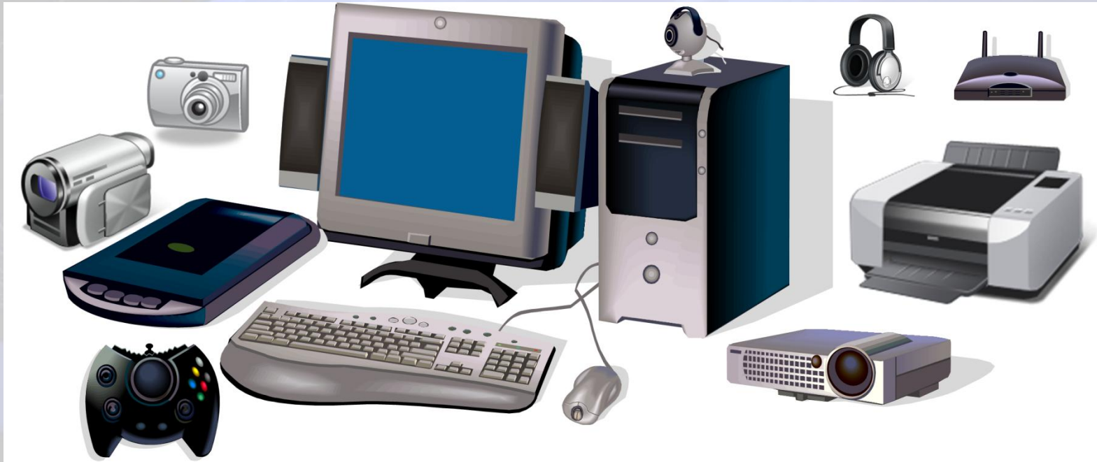
Sklopovski dijelovi računalnog sustava